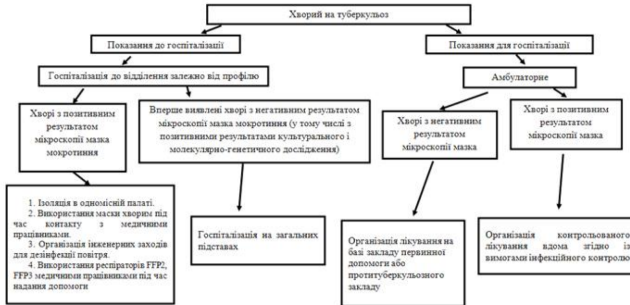
СХЕМА розподілу потоків пацієнтів на рівні спеціалізованої протитуберкульозної допомоги